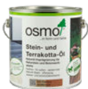
Stein- und Terrakotta-Öl

Dadurch, dass das Imprägnier-Öl frei von bioziden Wirkstoffen ist, kann es auch unbedenklich im Bereich von Lebensmitteln verwendet werden, z.B. bei Stein von Grills.