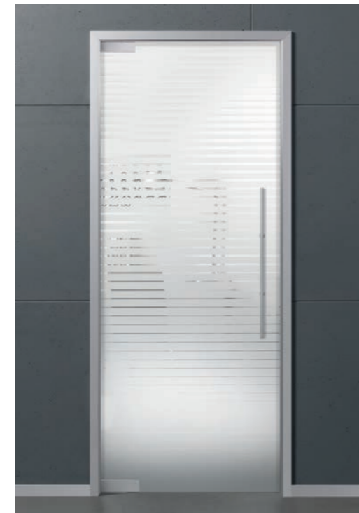
Pendeltür 1-flg. mit Zarge Tenda Classic White