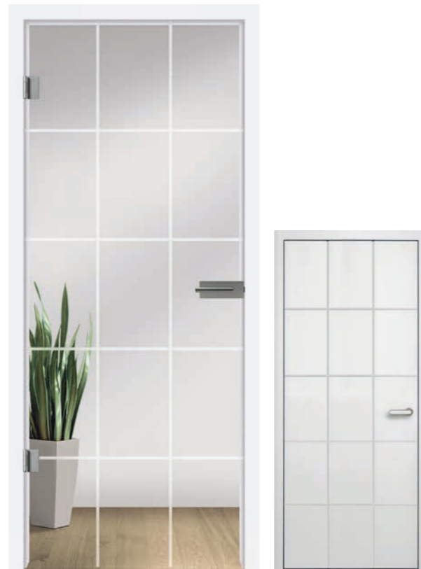
I&h Typ 286 Motiv matt / Fläche klar