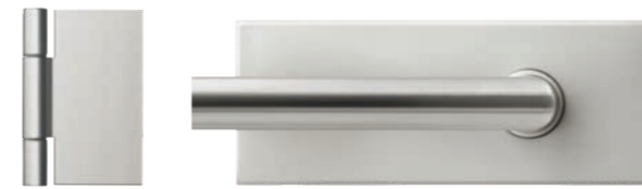
Square GTG ähnl. Edelstahl matt