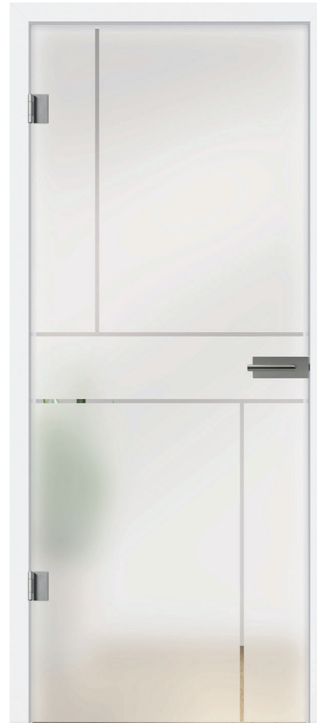
I&h Typ 281 Motiv klar / Fläche matt