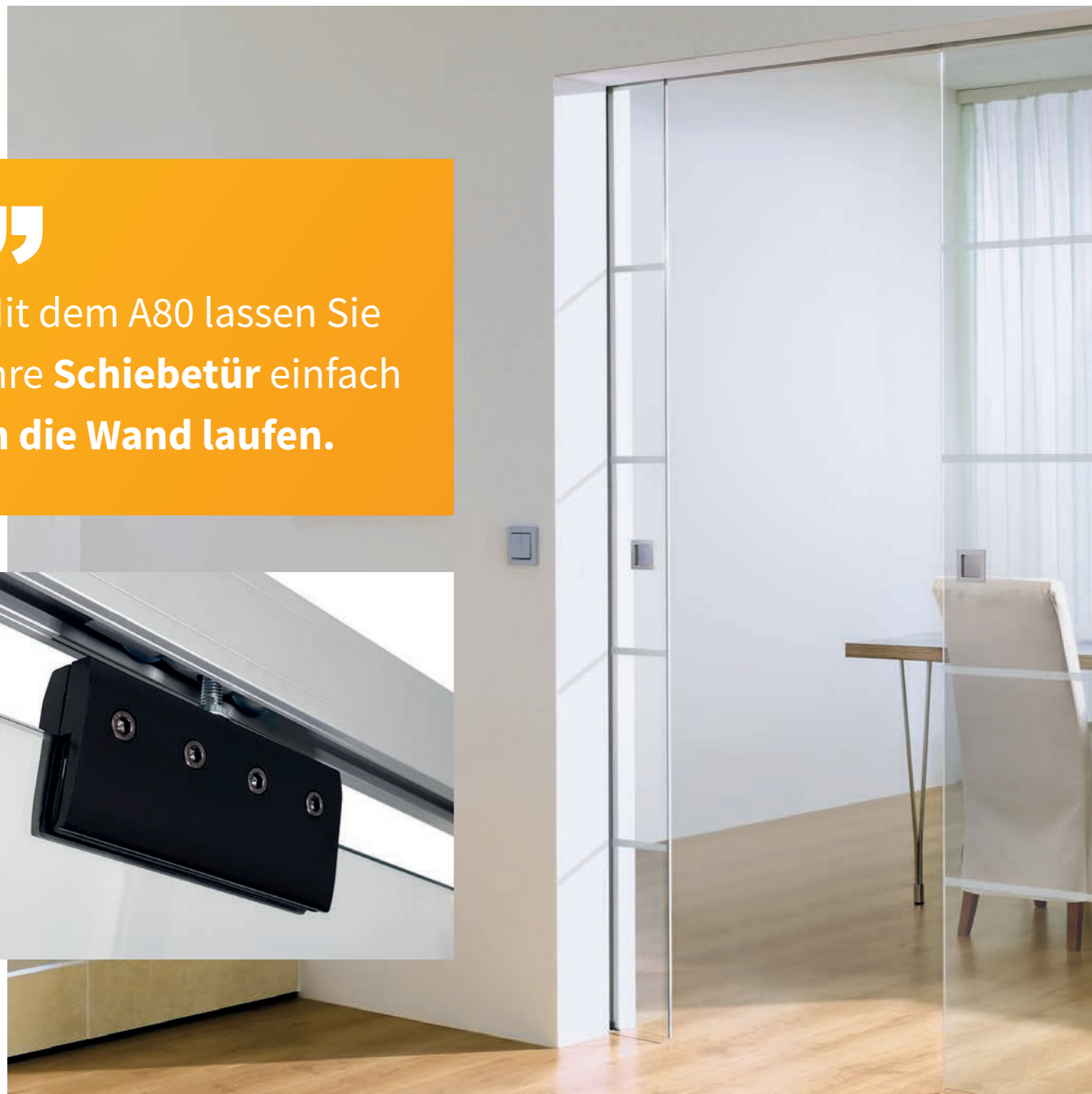
Atos, Streifen matt / Fläche klar

Mit dem A80 lassen Sie Ihre Schiebetür einfach in die Wand laufen .