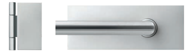
Impuls GTG Aluminium F1