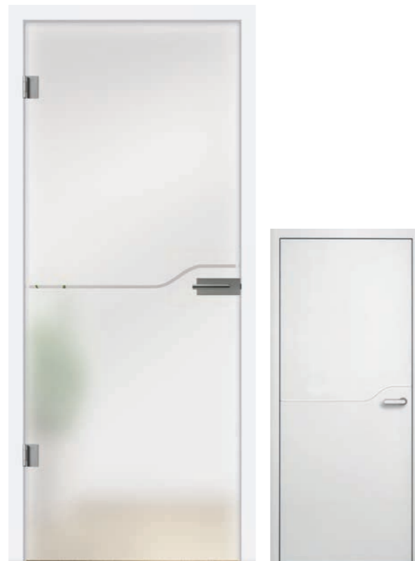
I&h Typ 288 Motiv klar / Fläche matt