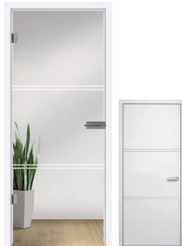
I&h Typ 213 Motiv matt / Fläche klar

Grauthoff Lines Art mit licht & harmonie im Designverbund.