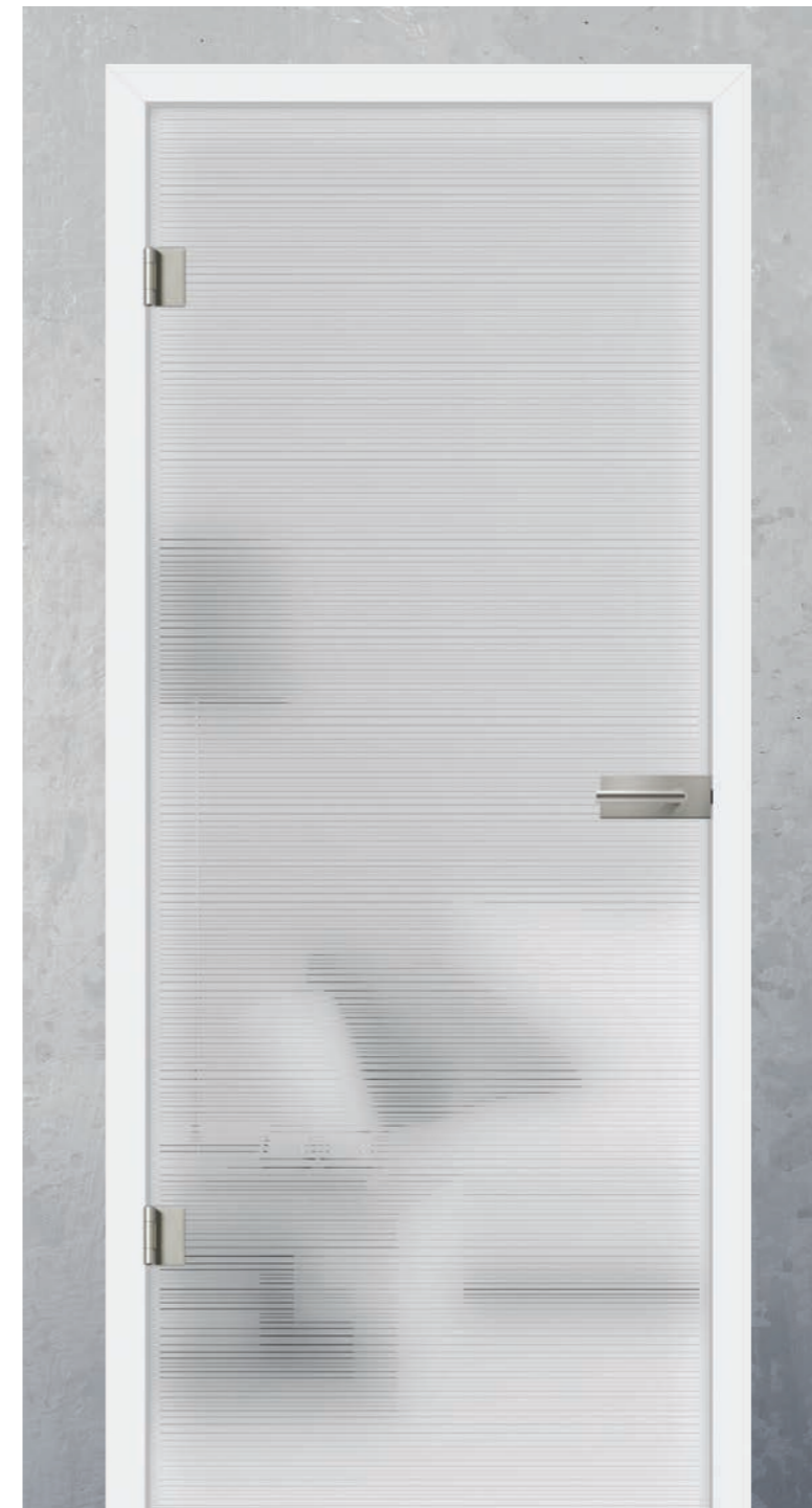
Avia quer Classic White | Beschlagset Square GTG, ähnl. Edelstahl matt