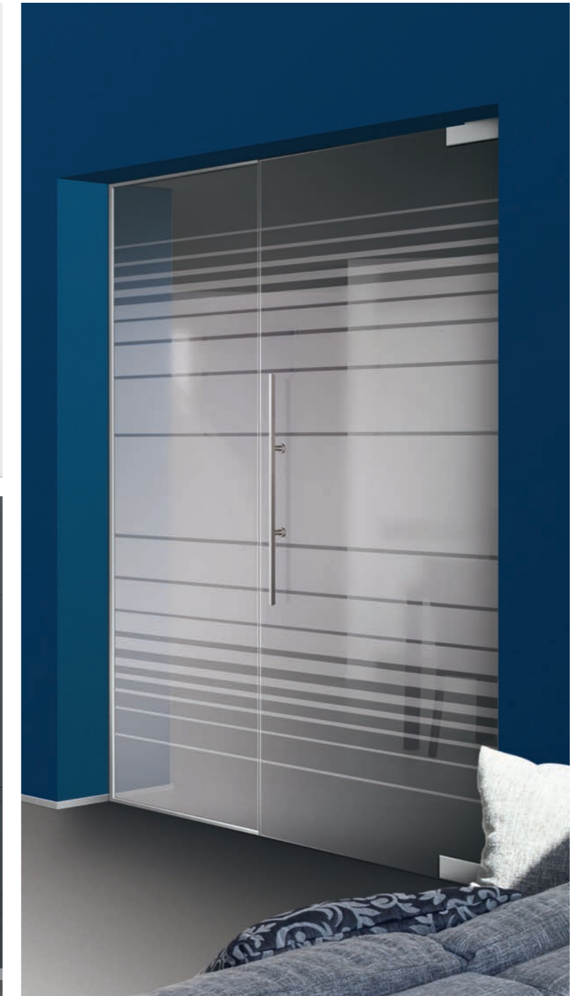
Pendeltür 1-flg. mit feststehendem Seitenteil, Struktura Typ 8, Motiv matt / Fläche klar