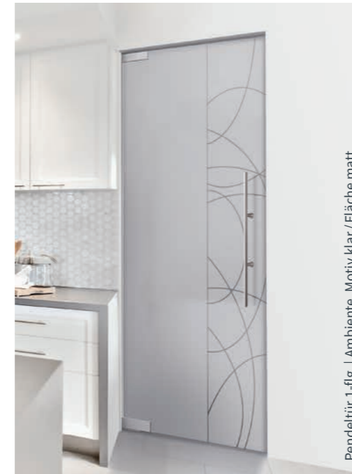
Pendeltür 1-flg. | Ambiente, Motiv klar / Fläche matt