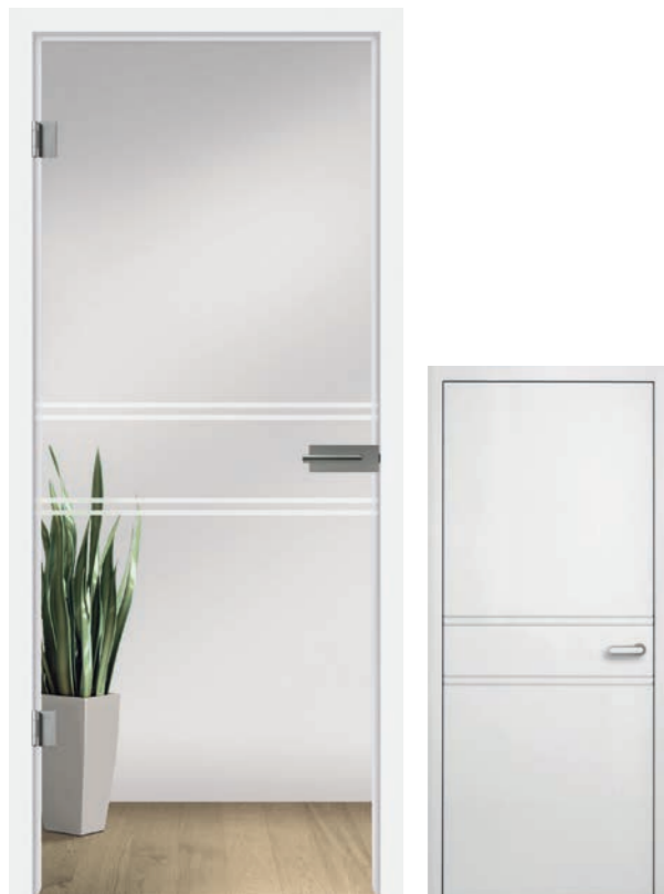
I&h Typ 227 Motiv matt / Fläche klar