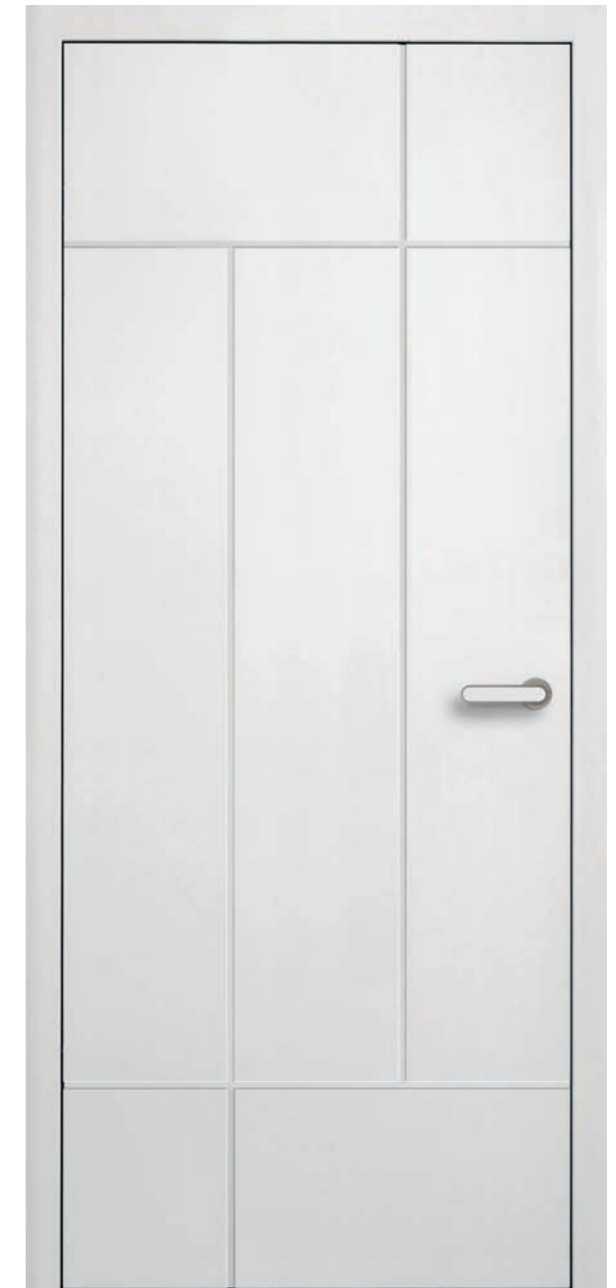
Grauthoff Typ 283