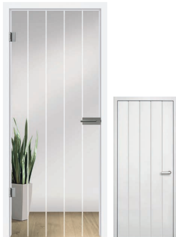
I&h Typ 287 Motiv matt / Fläche klar