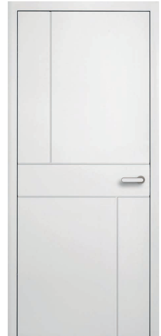
Grauthoff Typ 281