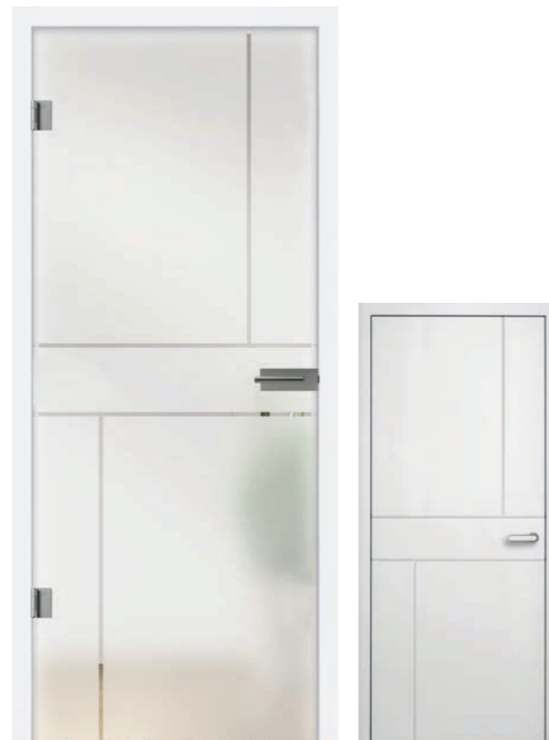
I&h Typ 282 Motiv klar / Fläche matt