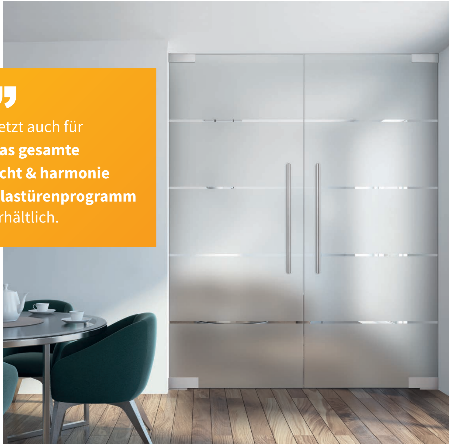
Pendeltür 2-flg. | Atos Classic White, Streifen klar / Fläche matt

Jetzt auch für das gesamte licht & harmonie Glastürenprogramm erhältlich.