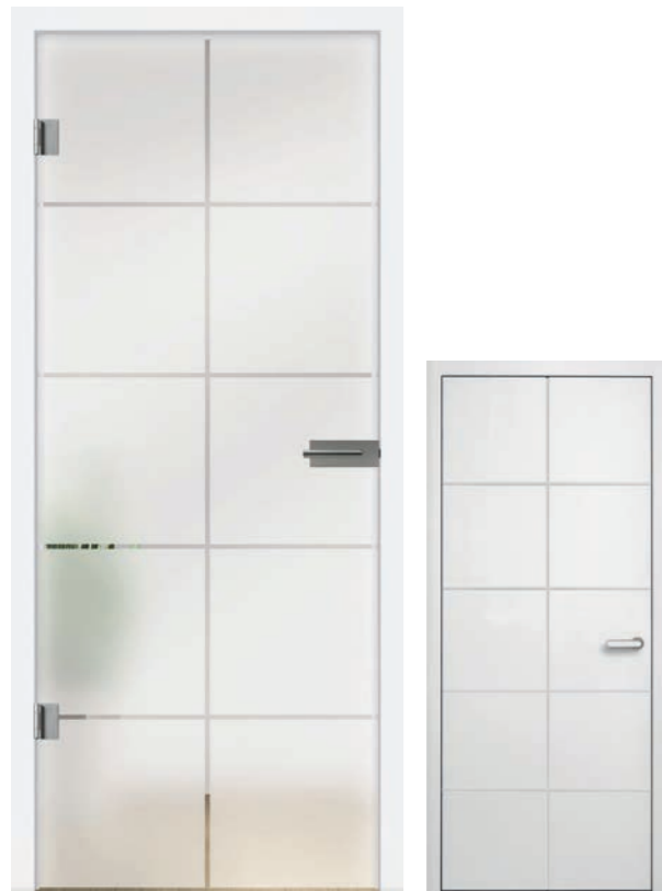
I&h Typ 285 Motiv klar / Fläche matt