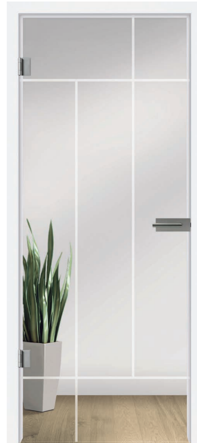
I&h Typ 283 Motiv matt / Fläche klar